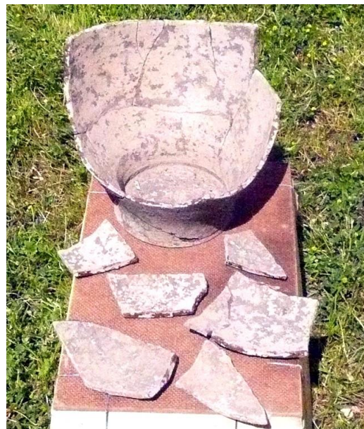
Poterie découverte à la Richardière

importants d'une grande villa gallo-romaine, avec des thermes privés, ainsi que de nombreux fragments de poteries et de moules, montrant qu'il existait là des fours de potiers.