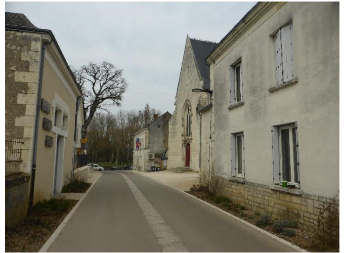
Rue Louis Bailly, après les travaux

Je suis particulièrement satisfait d'avoir, au cours de mon premier mandat, de 2014 à 2020, réalisé avec l'équipe municipale la totalité de notre programme, notamment la restauration de l'église Saint-Léger et les deux premières tranches de la réhabilitation du Centre bourg (rue Louis Bailly, Place du 11 novembre) ainsi que l'assainissement des Maisons Rouges et l'enfouissement des réseaux à Noyers.