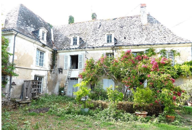
La Richardière en 2017

250 personnes ont pu assister aux projections présentées dans une salle du château et visiter le manoir de la Richardière.