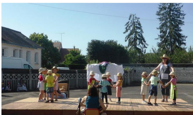
École Les Petits Loups de Nouâtre

Ce fut d'abord, le 11 juin, la Fête des écoles, où les 3 écoles du RPI nous ont donné des spectacles de qualité.