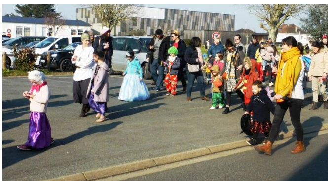
Voir d'autres photos, page 3

Nous avons constaté, avec un grand plaisir que, le samedi 4 mars après-midi, les rues de Nouâtre ont été joyeusement animées par le carnaval des écoles du Regroupement Pédagogique Maillé-Marcilly-Nouâtre, qui n'avait pas pu avoir lieu les deux dernières années.